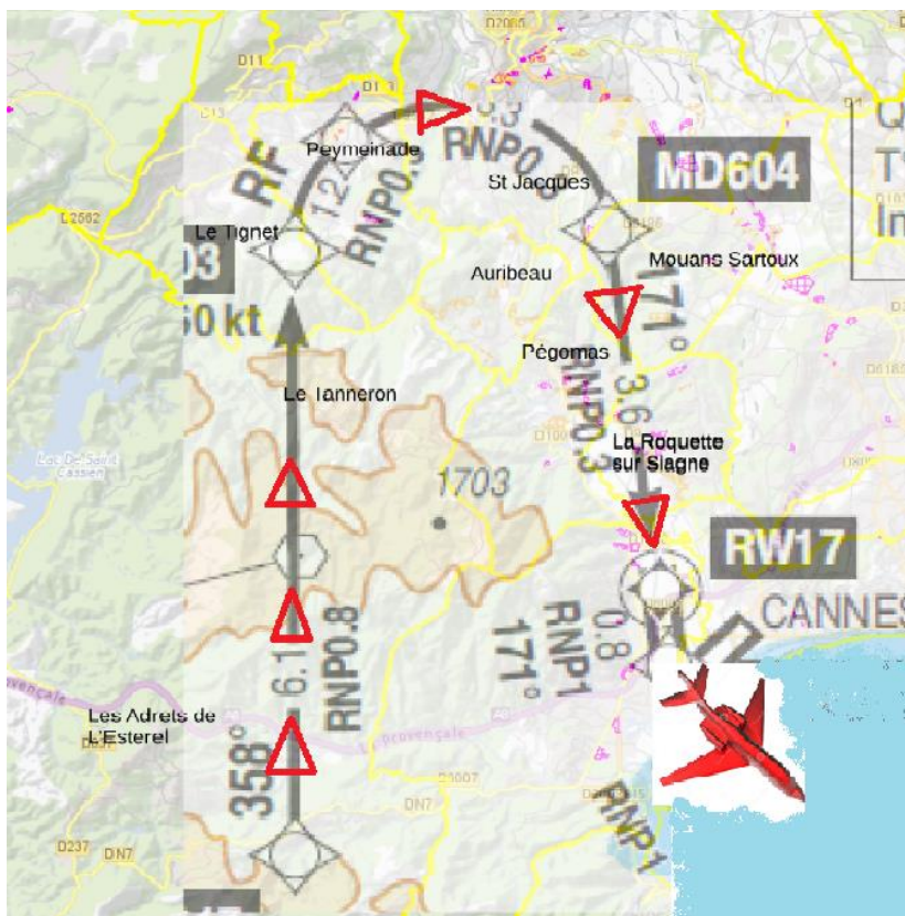
LA NOUVELLE ROUTE AERIENNE EN PROJET : NON !

10 COMMUNES IMPACTEES : GRASSE, TANNERON, AURIBEAU/SIAGNE, PEYMEINADE, TIGNET, MOUANS-SARTOUX, LA ROQUETTE/SIAGNE, PEGOMAS, SPERACEDES, ADRETS DE L'ESTEREL.